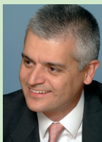
PIERRE KOSCIUSKO- MORIZET DIRECTOR GENERAL DE PRICE MINISTER

Si usted todavía no es emprendedor (por ahora), cuando se cruce con un emprendedor en su camino, no sólo piense en apoyarle (porque les necesitamos más que nunca para contrarrestar la subida del paro y redinamizar la economía), sino que ¡déjese seducir y plantéese emprender esa aventura con él.